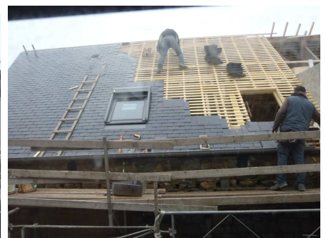
Les couvreurs posent les ardoises sur le toit.