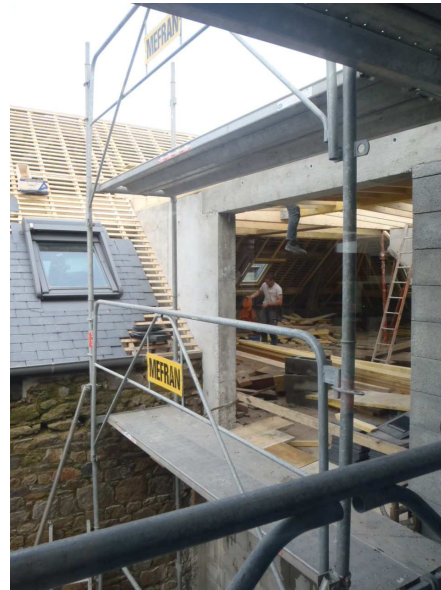
Les charpentiers mettent la charpente.